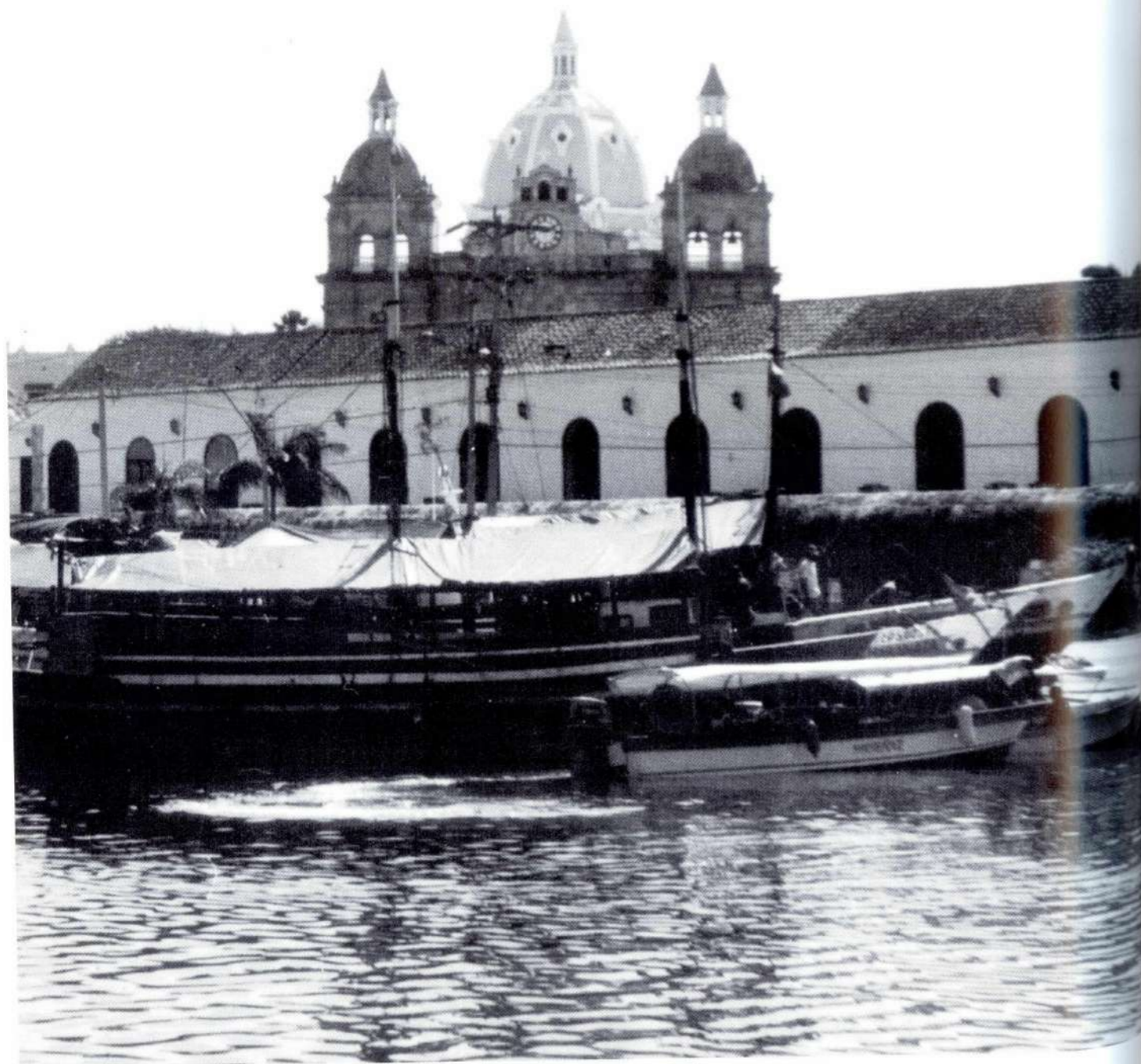
Cartagena de Indias