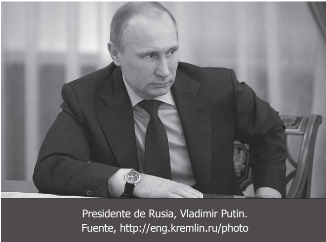
Presidente de Rusia, Vladimir Putin.

mismo tiempo, Rusia, China, Brasil, India o Suráfrica pueden “contribuir” construyendo la hidroeléctrica, o construyendo la autopista, o construyendo los satélites necesarios para los programas de comunicaciones. Es una cooperación que, como puede apreciarse, debe merecer todo el análisis posible.