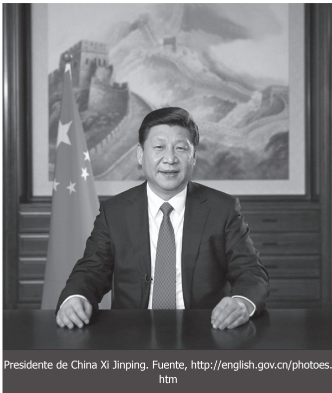
Presidente de China Xi Jinping.

Así mismo, señaló los denominados “tres motores: comercio, inversión y cooperación financiera” , como pilares que deben estimular y promover la cooperación práctica con China, a fin de alcanzar el desarrollo integral.