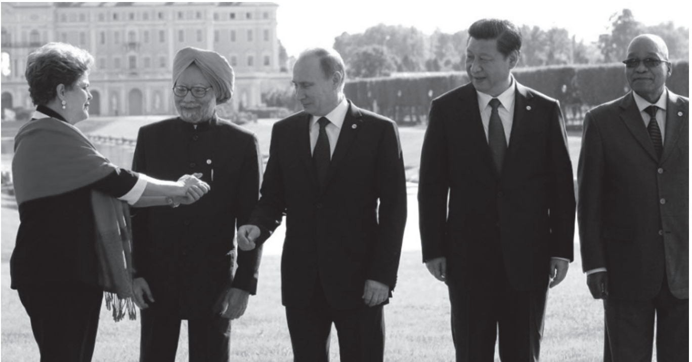
De izquierda a derecha, Dilma Rousseff, Presidente de Brasil; Manmohan Singh, Primer Ministro de la India; Vladimir Putin, Presidente de Rusia; Xi Jinping, Presidente de China; Jacob Zuma, Presidente de Suráfrica.

En concordancia con este contexto de pensamiento, es necesario considerar que, si para China es un objetivo trascendental el duplicar el producto interno bruto que tenía en el año 2010, entonces, ellos deben tomar en cuenta a muchos de los países emergentes